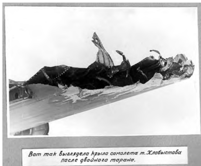
Вот так выглядела крыло самолета т. Хлобыстова после двойного тарана.