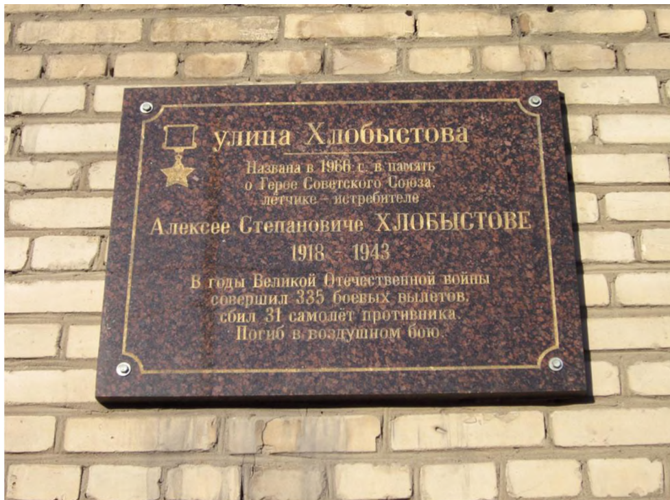
Аннотационная доска. Город Москва