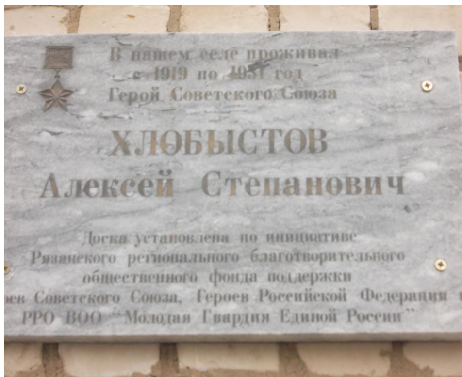
Мемориальная доска установлена на здании местной школы в с. Елино